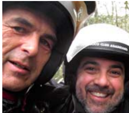
Molts amics catalans!

Seit Jahren verfolge ich diese Veranstaltung über die Website todotrial.com, leider sind immer nur wenige Teilnehmer aus der Schweiz am Start. Ab Genf sind mit einer