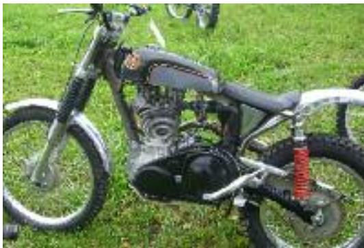
Ariel 500 special.

ähnlichen Orten und etwas schwieriger, oder liegt es an den Rest-Promillen im Blut? Bei der Bachsektion sehe ich viele 5er in der schweren Spur, scheinbar hat es auch den späteren Sieger Chris Aebi mit Lenkerbruch erwischt. Ich kann mich mit einer 3 hochretten. Somit kassiere ich doch 11 Punkte in den 12 Sektionen, aber keine 5. Die kommt dann in der nächsten Runde, weil ich in der Bachsektion mit 1 bis 2 durchkommen wollte, aber den Motor abwürge, dafür die schwierige Passage gut meistere. Egal, es macht Spass und das Wetter ist einfach prächtig. Die letzte Sektion ist wie immer eine Gaudisektion, wo man 2 Ringe über eine Kuhgeweih werden muss. Den 2. Wurf muss ich aus dem Handgelenk